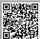
《教学月刊·小学版》 (综合)邮政订阅二维码