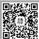
教学月刊微信 公众号二维码