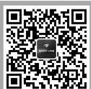
《教学月刊·小学版》 微信公众号二维码